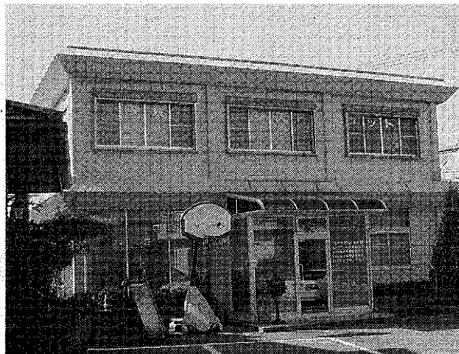
アシストネットの本社(2階)

同社では、こうした「ソフト」と「ネットバンク」を組み合わせ、業務効率化を図る。事務部門の負担を軽減し、コア事業に経営資源を集中してもら